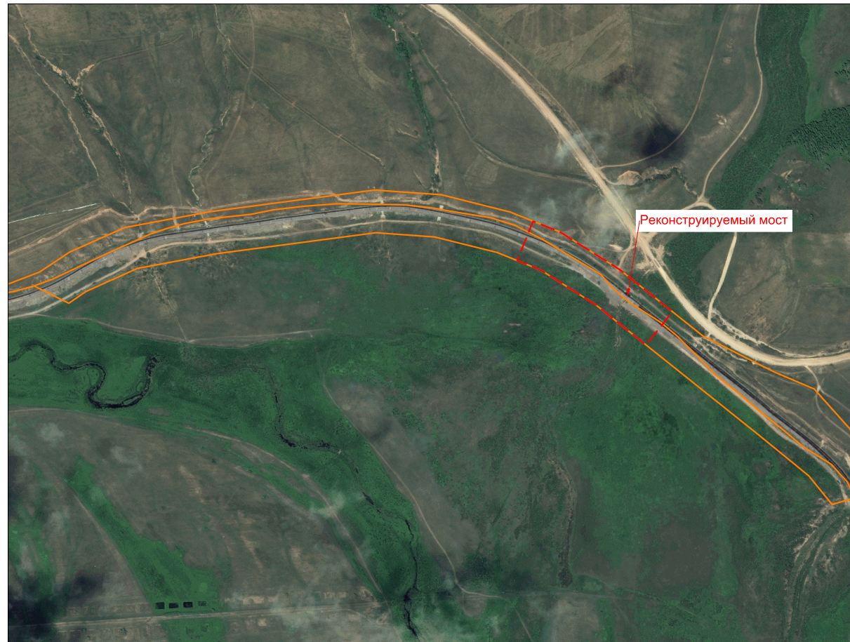
Схема расположения элемента планировочной структуры М 1:10000